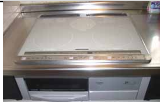
ガスレンジからIHに電化リフォーム K様邸